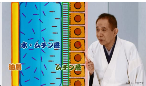
●その二「見過ごさないで。目の乾き」より