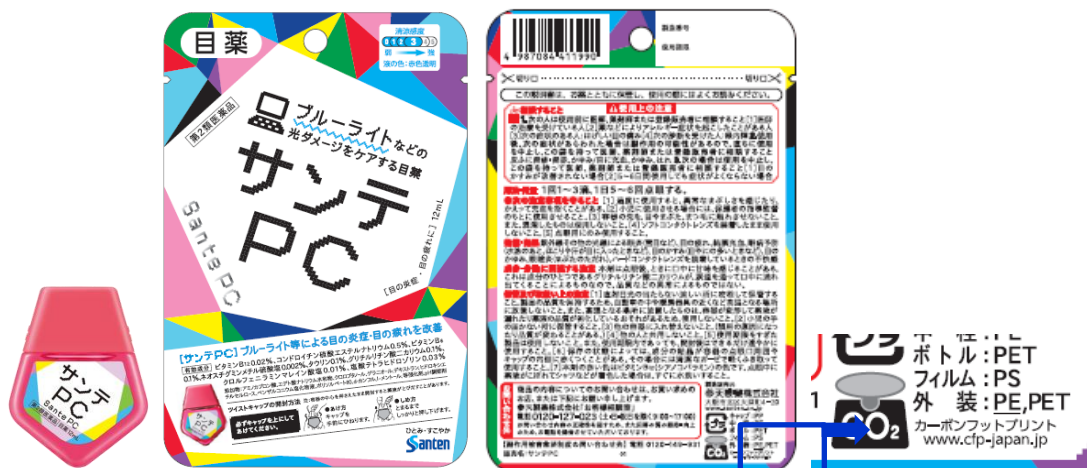
※外部包装(パウチ袋)のカーボンフットプリントであり、製品全体は対象ではありません。